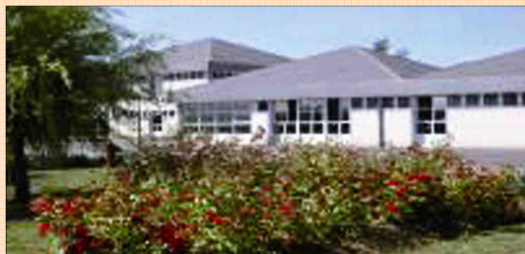
Foyer de La Plaine—Aubergenville